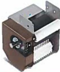
Traino nastri Belt drive unit